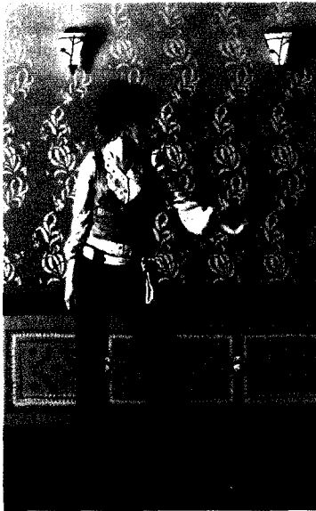
Fig. 10. 디자인①