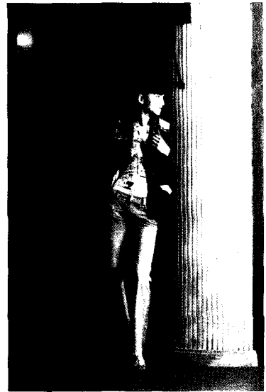
Fig. 14. 디자인⑤