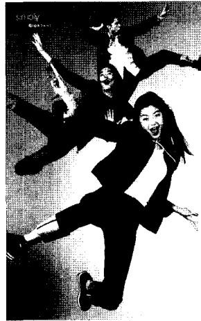
Fig. 2. GIORDANO, 2002 2002년 지오다노 컬렉션