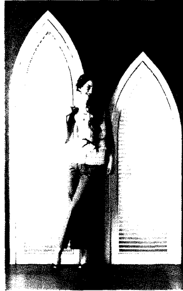
Fig. 11. 디자인②