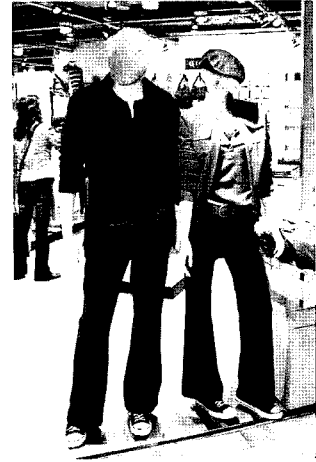
Fig. 3. GIORDANO, 2004 2004년 지오다노 컬렉션

과거 GIORDANO는 단조로운 색상의 전개 및 디자인의 단순화로 폭넓은 소비자층에게 튀지 않는 편안함을 어필했다. <Fig. 1>, <Fig. 2>에서 보이는 것처럼 디테일이 없는 진 팬츠와 셔츠는 GIORDANO의 대표 아이템으로 성장해왔으며 모노톤의 셔츠와 스웨터 또한 이지 캐주얼의 대명사로 불릴 만큼 많은 소비자들이 선택했던 상품이다.