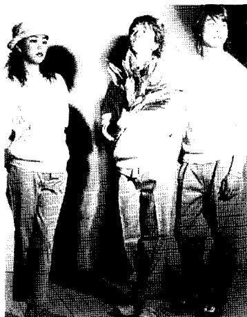
Fig. 4. TBJ, 2002 2002년 티비제이 컬렉션

그러나 2003년부터는 GIORDANO, TBJ의 변화와 비슷하게 색상 및 디자인 부분의 변화를 추구하고 있다. <Fig. 8>의 의상은 내추럴톤에서 탈피하여 포인트 컬러와의 매치를 시도하였으며, <Fig. 9>에서와 같이 원색의 레드컬러를 사용하여 경쾌하고 활동적인 느낌을 표현하기도 하였다. 디자인 측면에서도 점퍼 위주의 아웃 웨어에서 벗어나 재킷의 구성을 늘려 타겟