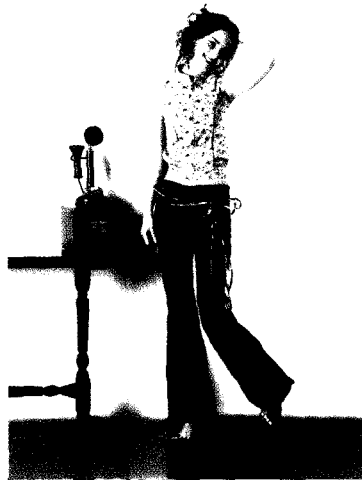
Fig. 13. 디자인④