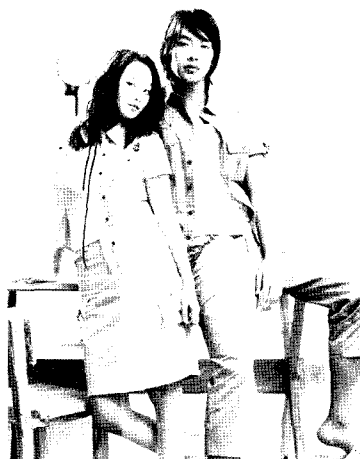
Fig. 5. TBJ, 2003 2003년 티비제이 컬렉션