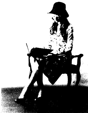
Fig. 12. 디자인③