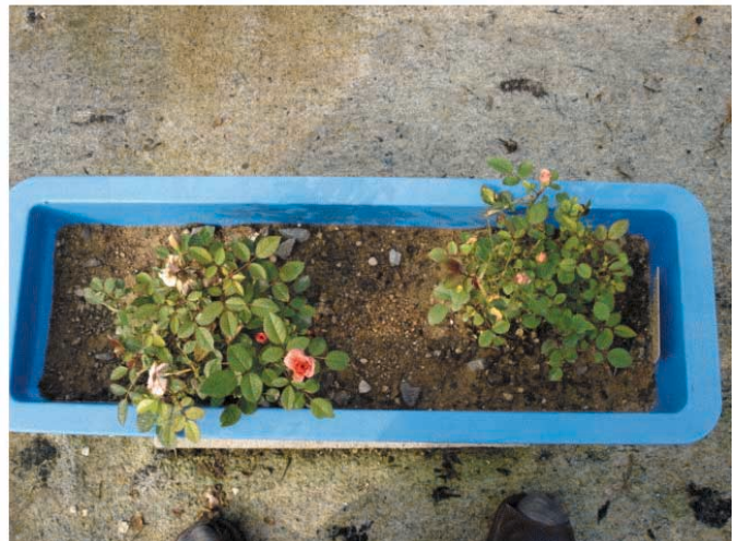
잔디와 조경수목을 대상으로 성장속도를 비교해본 결과로 약 35% 이상 성장속도가 빨라짐을 확인하여 퇴비로서의 우수성을 입증하는 자료(왼쪽 위 : 녹생토 사용한 잔디, 오른쪽 위 : 녹생토사용 안한 잔디, 왼쪽 아래 : 녹생토 사용한 장미, 오른쪽 아래 : 녹생토 사용 안한 장미)