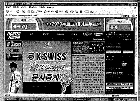
e스포츠 사이트 <파이터포럼>

알고 싶어지며 대회의 전반적인 흐름을 파악하고 싶어진다. 당연히 응원하는 팀의 승패에 영향을 미칠 다른 팀들 간의 경기 결과에도 촉각을 기울이게 된다. 응원하는 팀이 잘하면 왜 잘하는지 얘기하고 싶고 못하면 무엇이 문제인지 분석하려 든다. 분석한 결과를 다른 사람들에게 말해주고 싶고 자신이 보고 느낀 감동을 다른 사람들과 함께 나누고 싶어진다. 온라인은 마니아들의 욕구를 확실히 충족시켜줄 수 있는 공간이다. 사커라인은 해외축구 마니아들의, 파이터포럼은 e스포츠 마니아들의 가장 좋은 모임장소이다.