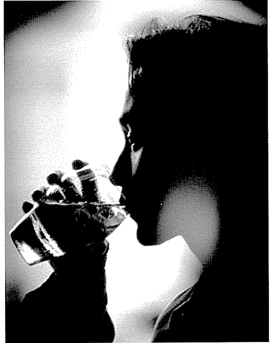
당뇨병환자의 변비는 위낙 흔하기 때문에 충분한 수분과 섬유소 섭취가 중요하다

당뇨병환자에서 변비는 위낙 흔하기 때문에 대개 자가 치료하는 것이 보통이며 좋은 배변 습관을 가지고, 규칙적으로 운동하고, 적절하게 수분을 섭취하고, 섬유소가 많은 음식을 섭취하는 것이 도움이 된다. 필요에 따라 약물을