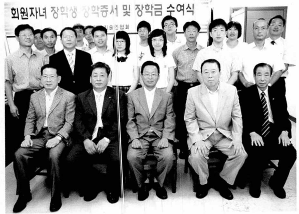
▲ 장학금 수여식