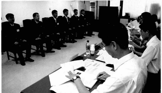
• 일 자 : 2006. 8. 28(월) • 장 소 : 협회 대회의실