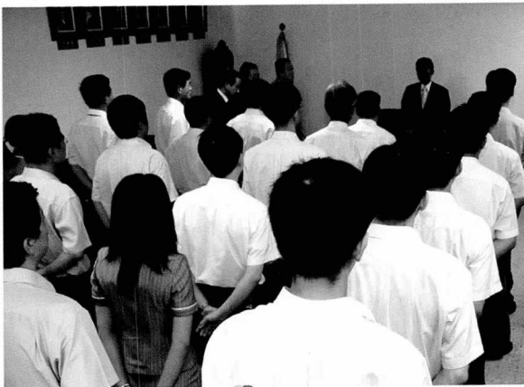
▲ 직원 월례조회