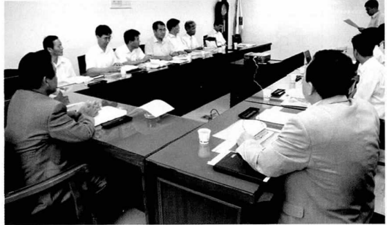
• 내 용 : ‘전력기술인의 교육훈련제도 개선 및 기술의 보급·촉진에 관한 연구’ 용역 결과 발표회