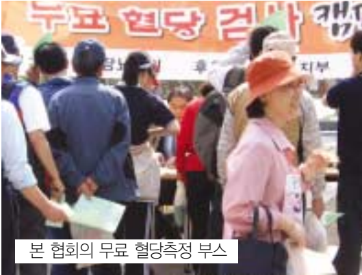
본 협회의 무료 혈당측정 부스