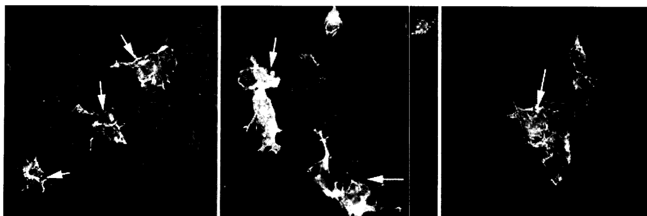
Figure 3. Cellular morphology of Fmn2-expressing 293T cells. Expression of Fmn2 is observed in 293T cells transfected with full-length Fmn2 by immunofluorescence staining. DNA was stained with TO-PRO-3 (blue), actin with Phalloidin-Alexa 546 (red), and Fmn2 with anti-Fmn2 polyclonal antibody followed by anti-rabbit Alexa 488 (green). Yellow color is observed whenever actin and Fmn2 are co-localized. In this figure, there is no cell with Fmn2 expression alone. Notably, Fmn2 is co-localized with actin filaments in paired cells undergoing or finishing cytokinesis.

어려운 점이 있으나 (unpublished observation, Lim et al.), 최근 한 마이크로어레이 데이터에서 난자 내 발현이 확인되었다. 34 한 연구팀에 의해 수행된 임상관찰 연구에서 원인불명의 불임환자 7명과 62명의 가임여성들의 FMN2 유전자 염기서열을 비교하였다. 그러나 특정 염기서열의 차이와 불임의 상관관계에 대한 의미있는 결과는 도출되지 않았다. 35 Fmn2 -/- 마우스의 표현형을 미루어 보아 원인불명의 불임보다는 비정상적 난자성숙, 즉 극체 방출을 못하는 난자를 생산하는 여성들을 대상으로 한 FMN2 발현 조사 또는 sequence 분석을 통해 연관성을 점검할 필요가 있다.