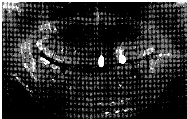
Fig. 3. Completed rigid internal fixation followed by gap-free reduction on postoperative panorama.

에서 골절편 간의 틈이 최소가 되도록 손으로 대략적인 골정복을 시행하였다. 이 때 응고된 혈액이나 섬유화된 조직이 골절편 주변에 있다면 식염수 세척으로 제거해야 한다. 하악 우각부의 정복을 진행하기 전에 하악 정중부 골절편을 reduction clamp로 맞춘 후 2개의 4-hole plate로 고정하였다. 이어 하악 우각부 골절선의 위치에 상응하는 얼굴 피부에 약 5mm 정도의 절개를 가하여 구강 내로 개통한 다음 mini-implant 식립을 위해 드라이버를 골절선 중양을 향하여 구강 내로 위치시켰다. 골절선에 인접한 적절한 위치를 정하여 mini-implant를 식립하되 하치조 신경 상방으로 두 개, 하방으로 두 개를 식립한 후 드라이버를 제거하였다. 여기서 다시 수조작을 통하여 근심 골편과 원심 골편 사이의 틈이 최소가 되도록 골정복술을 시행한 다음 약간 고정을 시행하였다. 하치조관을 중심으로 상방과 하방에 식립된 mini-implant끼리 각각 수술용 철사를 이용하여 결찰하게 되면 근심 골편과 원심 골편 사이의 틈은 거의 없어지게 된다(Fig. 2). 이 때 술자는 하악 우각부 상연의 벌어짐을 막기 위해 상방에 식립된 두 개의 mini-implant의 dual-head와 골과의 접촉부에 최대한 밀착하여 철사를 결찰하였다.