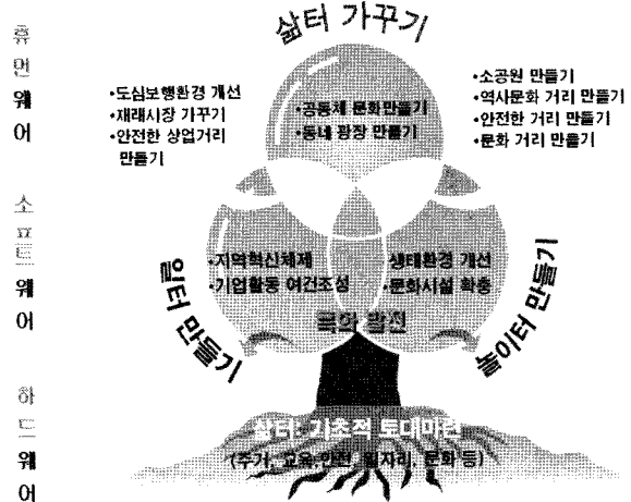
그림 2. 살고 싶은 도시만들기 개념도

께 '가꾸기'의 개념도 포함되어 있는 것으로 이전부터 진행되어 온 주민 참여 운동들도 제도적 체계 속에 포함시키고 있다.