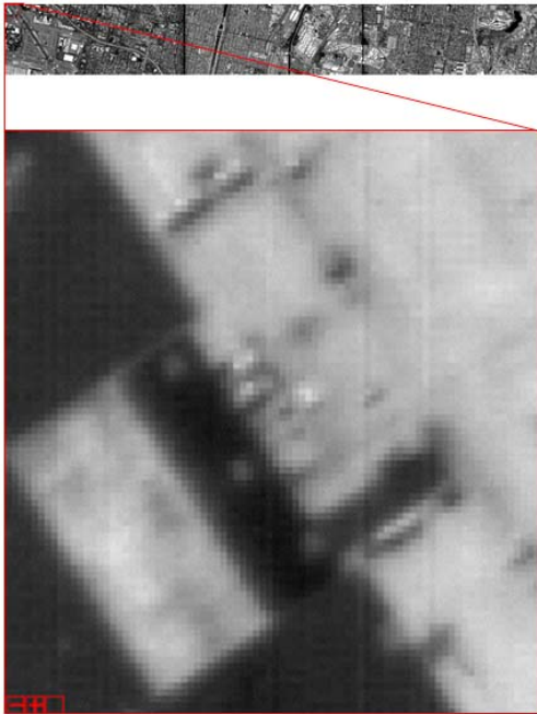
그림 2. test data의 보정 전 전체 영상과 부분 확대 영상