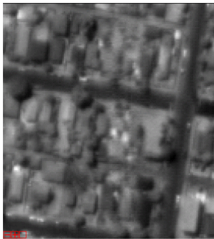
그림 4. butting zone 영역의 raw 영상(위)과 NUC 보정된 영상(아래)