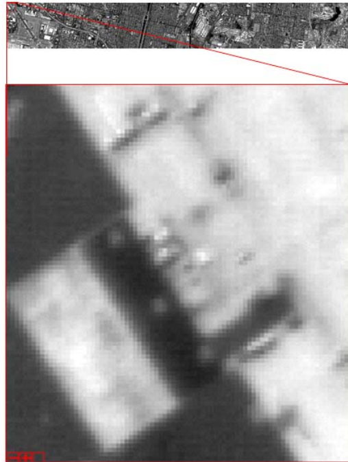
그림 3. test data의 보정 후 전체 영상과 부분 확대 영상

이를 구현하여 test 지역의 NUC 보정을 수행하였고, 다음은 그 결과이다.