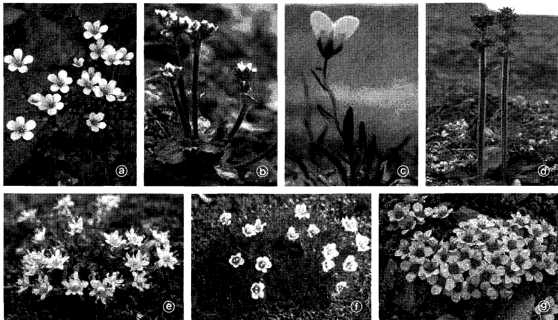
Fig. 1. Flowering characteristics of typical Saxifraga species collected from Norwegian Arctic Svalbard, Brøgger-halvøya. a: S. cernua , b: S. nivalis , c: S. herculus , d: S. hieracifolia , e: S. aizoides , f: S. caespitosa , g: S. oppositifolia .

16종의 서로 다른 Saxifraga 종의 DNA 분리를 위해 각각 100mg 동결된 잎 조직을 이용하였으며, DNeasy Plant Mini Kit(QIAGEN, USA)를 활용하여 분리하였다. 분리된 total DNA는 50~400µg/ml로 확인하였으며, 각각 200ng/mL로 농도를 맞추었다. PCR은 Accupower PCR Premix(Bioneer K2014, Korea)를 이용하였으며, 100 pmole의 URP random primer(Seolin Scientific, Korea, table 2)와 200ng template DNA를 포함한 최종 20µL의 반응액을 제조하여 수행하였다. 증폭을 위한 반응은 최초 5분의 pre-denaturation 후 94°C/1분, 55°C/1분, 72°C/2분의 과정으로 40회 수행하였으며, 이후 72°C에서 5분간 반응 후 4°C에 저장하였다. PCR 산물은