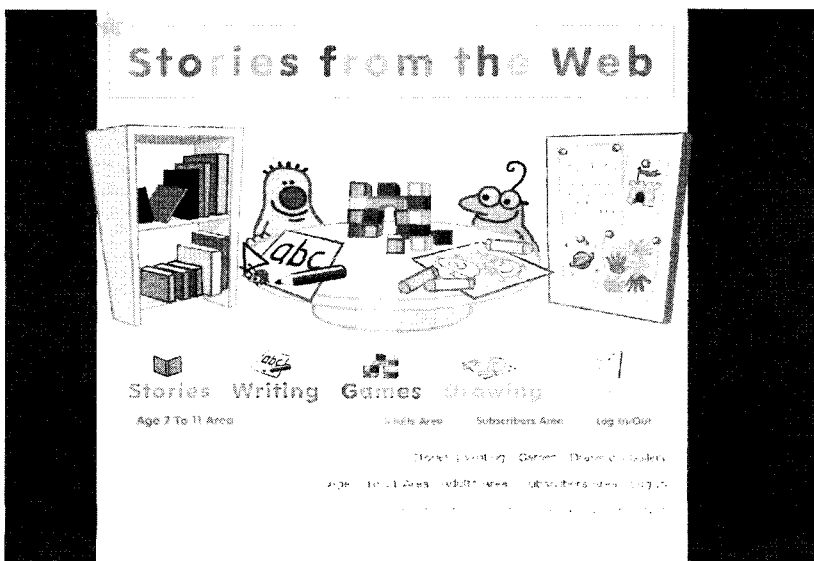
(그림 1) 0-7세 어린이방의 홈페이지