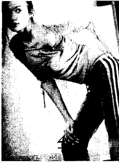
<그림9> 면(스트레치코튼), 스포티브 스타일, 엘르 2003. 5.