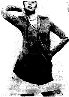
<그림1> 스포티브 스타일, 그린 집업점퍼, 마리 끌레르 2005. 3.