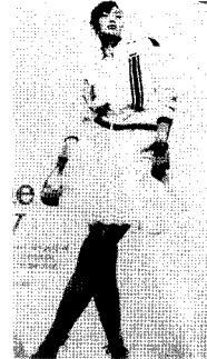
<그림2> 스포티브 스타일, 트레이닝 점퍼, 마리 끌레르 2005. 3.

러운 외출복의 형태로 나타났으며, 과거 스포츠 웨어의 클래식 룩에서 액티브하고 젊고 강한 이미지로 나타났다.