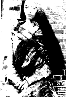
<그림5> 에스닉 스타일, 네팔식 재킷, 엘르 2002. 11.