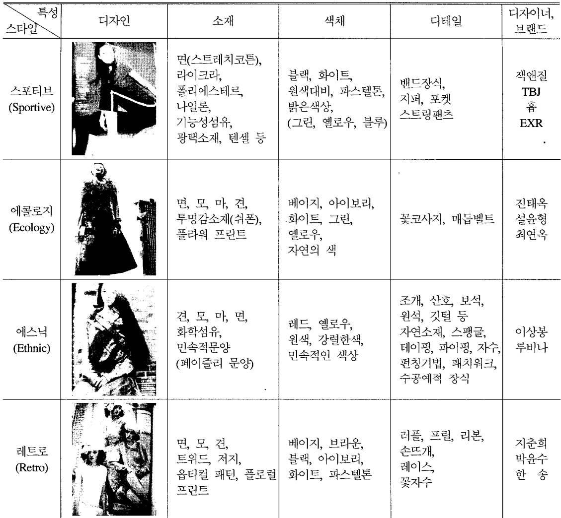
<표4> 국내 웰빙 패션 특성