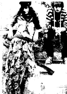
<그림3> 에콜로지 스타일, 플라워프린트 스커트, 엘르 2005. 11.