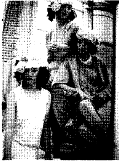
<그림7> 레트로 스타일, 1920년대풍, 엘르 2004. 2.