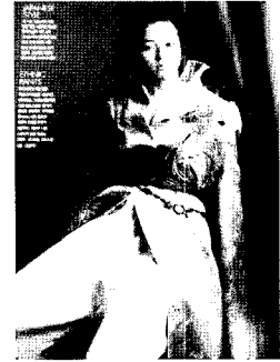
<그림11> 견(새틴), 에스닉 스타일, 엘르 2002. 12.

첫배가량 증가하였으며, 레트로 스타일은 0.5배 정도 증가하였다. 2001년부터 2005년까지 전체적인 웰빙 패션은 두배 이상이 증가한 것으로 분석되었다.