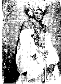
<그림10> 미가공 느낌의 소재, 에콜로지 스타일, 마리끌레르 2005. 2.