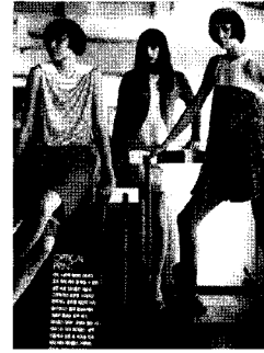
<그림8> 레트로 스타일, 모즈룩, 엘르 2003. 8.