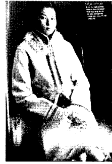
<그림6> 에스닉 스타일, 에스키모 모피장식 코트, 마리 끌레르 2000. 12.

표현되었으며 전원적인 트렌드로서 활동성이 있는 편안한 소재의 스커트와 플라워 프린트는 자연으로의 복귀의 이미지를 담고 있다.