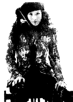
<그림12> 스포티브 스타일, 레드와 그린의 대비, 마리 끌레르 2005. 1. 그린과 옐로우 프린트, 마리 끌레르 2005. 4. 레드와 블랙 대비, 마리 끌레르 2002, 12.