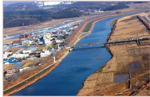
아산시 중심천인 곡교천

역은 대부분 농업진흥지역이나 보전산지로 지정되어 있어 환경생태계는 양호하나 무분별한 레저 및 수상시설 설치로 환경정비가 필요한 실정이다.