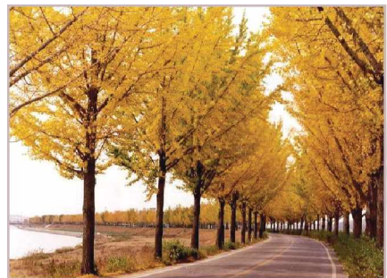
충무공 얼이 스며있는 은행나무 길

셋째, 염치읍에는 아산시민의 휴양·휴식 수변공간으로 곡교천과 염치저수지가 위치하고 있다. 염치읍 하단부에 위치한 곡교천은 국가하천임에도 불구하고 오염하천이라는 오명을 가졌지만, 건설교통부와 아산시는 곡교천일대와 주변부지, 은행나무 거리를 대상으로 친수환경 명소화사업을 추진 중이다. 이와 함께 염치읍 동정리, 석두리 일원에 위치한 염치저수지는 1950년에 설치되어 농업용수 저수지(유효저수량 3,059천톤)로 이용되고 있으며 현재 운영관리는 한국농촌공사에서 맡고 있다. 저수지 인근 충무유원지에는 수영장·테니스장·낚시터·식당·주차장 등 다양한 시설을 갖추어져 있어 하절기 방문객이 증가하고 있다. 염치저수지 주변지