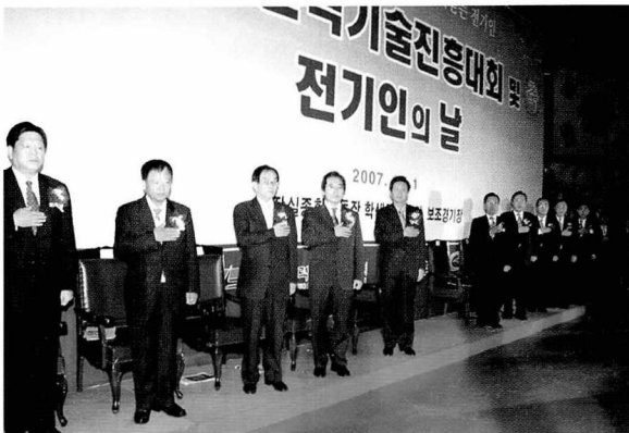
▲ 귀빈들의 국민의례 모습