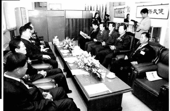
▼ 귀빈들이 VIP실에서 담소를 나누는 모습