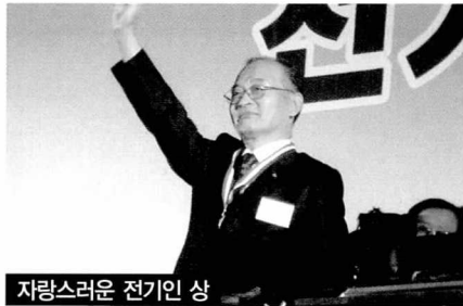
자랑스러운 전기인 상