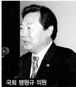
국회 맹형규 의원