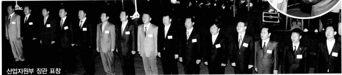
산업자원부 장관 표창