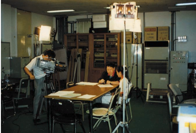
방송매체 앞에서 인터뷰하는 연습도 PST의 일부이다.