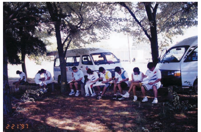
훈련 현장에서의 각종 검사는 선수의 심리프로파일을 파악하는 중요한 수단이다(호주 스포츠과학연구소의 양궁 연습장에서 연습직전의 심리상태를 검사하는 모습).