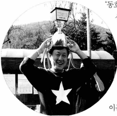
전사대회를 마치고 최연소 동호회장이 우승 트로피를 쏘보이며 기쁨을 함께 나누고 있다.

“동호회로 공식 탈바꿈하면서 회사로부터 운영자금 및 테니스코트 등의 시설 지원을 받고 있다”고 소개했다.