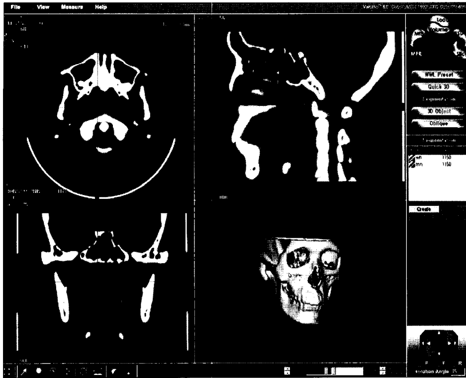
Fig 1. Three-dimensional image was constructed using V-works™ program.