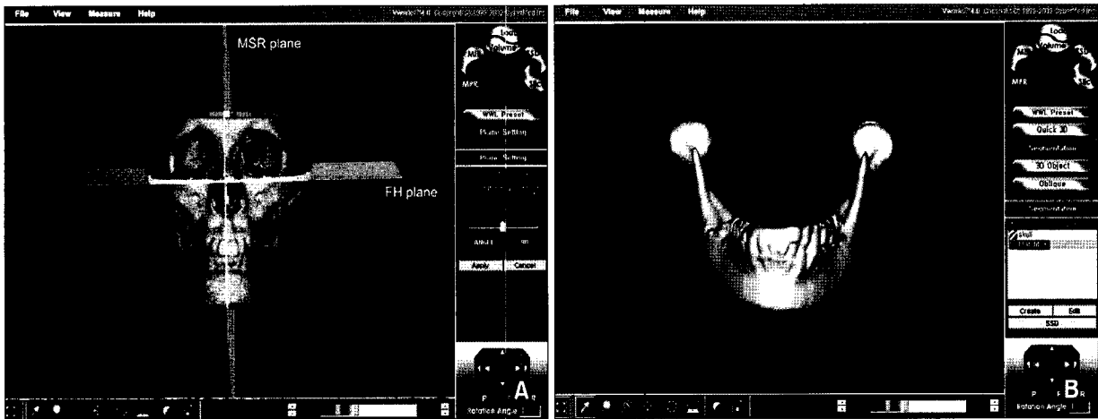
Fig 2. A, Construction of three-dimensional reference planes for measuring frontal and lateral ramal inclination (MSR plane; midsagittal plane, FH plane; Frankfort horizontal plane). B, The SOD file of the mandible was made in order to observe the mandible only.

게 설정할 수 있도록 하악골만 따로 분리하여 SOD (selection of demand) 화일을 제작하였다 (Fig 2).