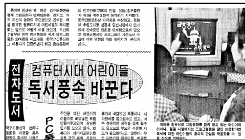
<그림 11> “컴퓨터시대 어린이들 독서풍속 바꾼다”(『中央日報』, 1993.2.9)

또한 컴퓨터 시대에 발맞춘 출판 형태들도 나타났다. 종이에 인쇄된 책 대신 컴퓨터 화면의 그림동화와 연재만화를 즐기는 PC 독서문화가 전개된 것이다. 93년 2월 한국 PC통신은 한국 전래동화와 세계명작, 그림동화 등을 인터넷을 통하여 연재하기 시작했고 호응도 좋았다. 80) 이와 함께 스크린북, 게임북, 하이퍼북 등 어린이와 학부모들의 눈길을 끄는 어린이 도서들이 잇따라 선보였다. 종래의 책 개념과 다른 이런 종류들은 TV나 전자오락에 탐닉하는 대부분의 어린이들에게 인기가 높았다. 그 한 예로 『월리를 찾아라』 시리즈나 『슈퍼마리오』 시리즈는 선풍적인 인기를 얻었다. 81) 한편에서는 이러한 현상에 대해 흥미위주의 오락성이 높아 차분히 정독하는 습관을 들이지 못하게 한다는 평가를 내렸다. 82)