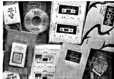
〈그림 8〉 오디오북(“독서도 음악감상하듯 오디오북 출판 활기”, 『中央日報』, 1994.2.23)