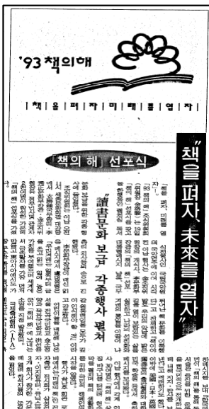
〈그림 3〉 “책의 해” 선포식(『中央日報』, 1993.1.19)

1993년은 ‘책의 해’로 선포된 연도이다. 이 한해는 ‘책을 펴자, 미래를 열자’, ‘책 읽는 사람이 이끄는 사회’라는 표어를 내걸고 독서문화를 보급하기 위한 각종 행사가 펼쳐진 시기이다. ‘책의 해’ 조직위원회가 주최하는 각종 도서전시회, 도서 교환시장, 명작의 고향 탐방, 전국순회 독서강연회 등을 비롯하여 독서운동을 위한 시민단체가 결성돼 회원모집에 들어가는 등 독자들의 관심이 따라 여러 가지 기회를 접할 수 있게 되었다.