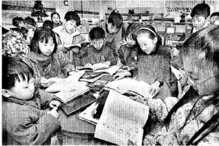
〈그림 2〉 “어린이전용 도서관 6곳 겨울방학프로 다양”(『中央日報』, 1994.12.13).

도서관에서는 91년도부터 보다 본격적인 이동도서관 운영에 나섰다. 지역을 순회하며 책을 대출해주던 것에서 더 나아가 역, 터미널, 운동경기장 등에 대기하면서 인근 주민이나 경기를 기다리는 사람들에게 책을 열람할 수 있도록 했다. 이 도서관은 대형버스를 열람실로 특수제작하여, 버스에 서가를 설치하고 열람석은 물론 냉·온장고까지 비치해 무료로 음료까지 제공했으며, 신간·우량도서와 VTR·TV까지 설치하여 비디오 프로그램도 시청할 수 있게 했다. 뿐만 아니라 전시·공연 등 각종 문화행사 정보자료도 비치했다. 열