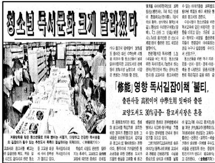
〈그림 12〉 “청소년 독서문화 변화-수능 영향 독서길잡이책 불티”(『中央日報』, 1993.12.29).

우량도서 20권씩을 선정하여 1주 1시간씩 일제히 독서 시간을 갖고 학생들로 하여금 이 책들을 반드시 읽도록 지시했다. 독서지도를 정규 교과활동의 일환으로 추진케 하려는 의도에서 비롯된 것이었다. 83) 1980년대 초에는 특히 공교육 내에 큰 변화가 일었던 시기로서 대학입시에서 본고사가 폐지되고 과외수업이 금지되었다. 소위 ‘7·30교육개혁’이라고 불리운 이 교육개혁은 ‘입시위주 교육’에서 ‘전인교육’으로 전환한다는 취지에서 비롯되었다. 달라진 교육 정책에 따라 고교교육 전반에서도 변화를 보이기 시작했다. 영어, 수학, 국어에만 치중했던 종전의 교육에서 ‘특별활동’ 시간을 활용한 독서, 수예, 서예, 운동 등의 교육으로 비중이 옮겨갔다. 84) 이러한 교육 환경의 변화와 함께 1980년대 초 정부의 ‘국민독서생활화’ 운동 추진 방안에서는 특별히 학교교육을 통한 독서생활 정착에 가장 큰 역점을 두고 있었다. 초·중·고교에서 학년별로 알맞는 필독도서를 선정하고 독서결과를 학습성적 평가에 반영케 했으며, 대학에서도 각기 도서선정위원회를 두고 독서지도를 강화시키도록 하였다. 85) 또한 86학년도부터 대학입시에 논술고사를 포함한다는 보도가 있자 독서의 필요성이 더욱 절실한 실정이 되었다. 그러다 88년도에 논술시험이 없어지게 되자 학교에서 독서지도 시간을 폐지하는 등 독서교육이 소홀해지기 시작했다. 86)