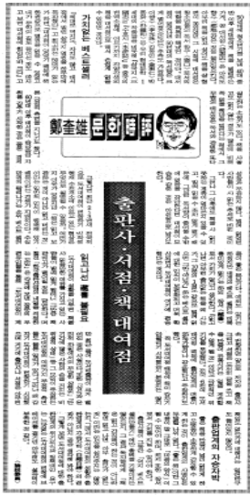
<그림 4> “출판사, 서점, 책대여점”(『中央日報』, 1994.12.26).

또한 90년대에 들어서서 정보화 사회의 핵심인 출판 산업의 전산화가 보다 시급하게 되었다. 출판계 자체의 노력뿐만 아니라 국가 차원의 지원·육성이 필요하다는 의견도 나왔다. 이에 ‘93서울