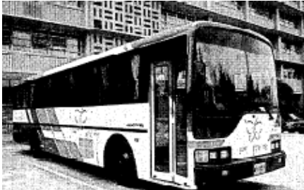
〈그림 1〉 ‘움직이는 도서관’ 버스(『中央日報』, “이동 열람도서관 본격 운영”, 『中央日報』, 1991.7.14)

판문화협회’가 공동 주관한 것으로 크게 독서토론회, 학술 심포지엄 등 독서 권장행사와 독서지도 강화, 독서환경 조성사업으로 구분됐다. 구체적으로 보면 도서관에서는 우수 독후감 모집, 문학강좌, 모범이용자 표창, 작가와의 대화, 어린이 글짓기대회, 구연동화 발표, 독서교실과 독서강연회 개최, 도서관교환장터 개장, 도서전시회, 독서 관련 영화상영, 시 낭송회 등 각종 기념행사를 펼침으로써 국민 독서의 생활화에 앞장섰다. 3)