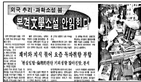
〈그림 5〉 “외국 추리·과학소설 북 본격문학소설 안 읽힌다”(『中央日報』, 1992.8.21)

이 때문에 자구책을 찾아 나선 인문·사회과학 출판사들은 다른 분야로 눈을 돌리거나 전문학술서 발행을 꺼리는 분위기가 확산되었다. 39) 전반적인 사회 분위기가 안정을 잃은 채 혼미를 거듭함에