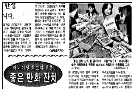
〈그림 10〉 “어린이날 최고의 선물 좋은 만화 잔치”(『中央日報』, 1993.4.23).

한편 출판사들은 국내 창작동화, 외국 현대 명작동화, 전래동화 등은 물론 교양, 교육, 철학 동화 류 등을 장기 기획물로 출판했다. 그 결과 아동도서 선택의 폭이 넓어지고 질적으로도 향상되었다. 민음사에서는 ‘어린이책’ 기획 시리즈로 『서정주 세계 만화집』 전5권, 『프랑스동화』 전10권, 『영국·미국동화』 전9권 등을 펴냈고, 국민서관에서는 전래동화·세계동화·생활동화 등 주제별로