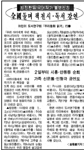
〈그림 9〉 “방정환 등 국내작가 동화 선정 전국 돌며 책전시 독서강연”(『中央日報』, 1994.10.28).

년도에 12개 초등학교 4, 5, 6학년 614명을 대상으로 실시한 ‘어린이 독서경향 및 독서환경 실태조사’ 결과에 따르면, 학생들이 가장 좋아하는 책이 명랑소설(23.5%)과 공포추리소설(22.1%)로 나타나 흥미 위주의 독서경향을 보였다. 또 책의 구입면에서 어린이가 직접 사는 경우(42.3%)가 어른이 사주는 경우(20.8%)보다 훨씬 많아 범람하는 아동 도서시장 속에 어린이들이 무방비 상태로 놓여있는 것으로 드러났다. 71)