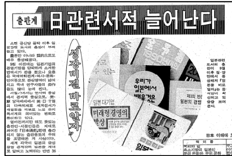
〈그림 6〉 “출판계 일 관련 서적 늘어났다”(『中央日報』, 1991.11.1)

92년도부터는 대하 역사소설 붐도 일었다. 『소설 제갈공명』, 『소설 강태공』, 『소설 이태백』, 『소설 맹자』, 『소설 논어』 등 중국 고대 역사적 인물들에 관한 소설들도 인기가 있었고. 57) 이지만, 정약용, 허준, 임궫정, 연개소문, 황진이, 김옥균 등 한 시대를 풍미했던 역사적 인물을 다룬 『소설 토정비결』, 『소설 목민심서』, 『소설 동의보감』 등이 교보서점 등 대형서점에서 베스트 순위에 올랐다. 출판사들은 이와 같이 90년대 들어 역사적 인물소설이 잘 읽히는 이유를 ‘당대의 삶을 총체적으로 그린 모범적 장편 부재’, ‘후기자본주의의 파편화된 삶에서 총체적인 옛 선인들의 삶의 형태에 대한 향수’, ‘다른 인물의 삶에 대한 인간본연의 호기심’ 등에서 찾았다. 58)