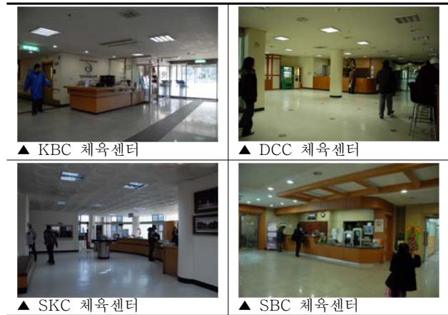
그림3. 프로그램 안내 및 등록동선

장애인전용화장실의 경우에 간이식 주름문으로 설치되어 있어 사용자의 심리적 불안과 프라이버시 보호의 측면에서 불리하며, 세면기가 모서리 부분에 인접하여 설치되어 있어 사용에 어려움이 있다. 내부 보조기구로서 휴지걸이가 멀리 설치되어 있고 세면기의 거울이 벽면과 동일하게 수직적으로 설치되어 있어 휠체어사용자에게 많은 불편함을 주고 있다.