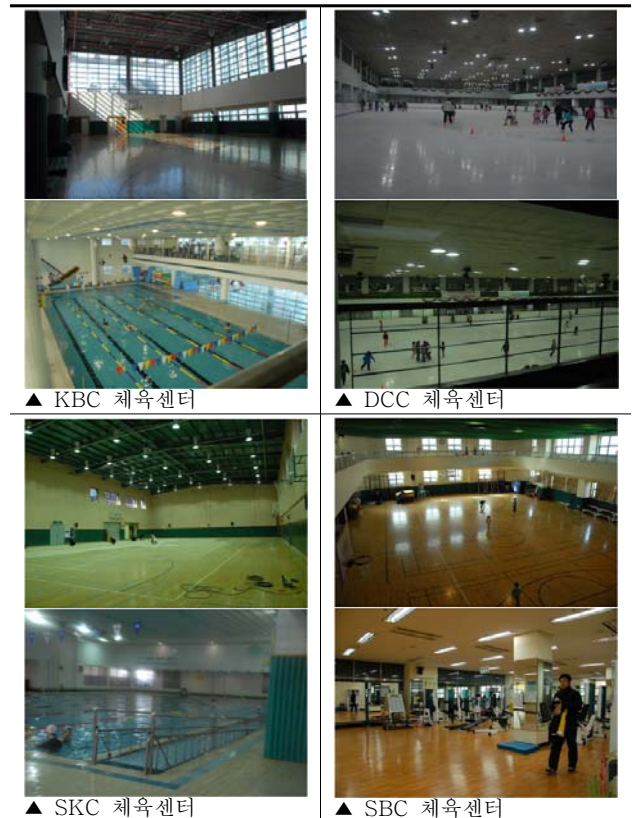
그림4. 프로그램 참여동선

엘리베이터를 통한 5층 체육관까지의 이동이 용이하나 체육관 출입부는 미단이 문 및 손잡이가 마주보는 벽체에 가까이 설치되어 있고 손잡이의 모양으로 인하여 사용에 어려움이 있다. 단차가 없는 바닥설계로 자연스러운 접근 가능하나 출입문의 관찰창이 높게 설치되어 휠체어사용자의 이용에 불편함이 있다. 또한 하단부의 지지없이 상단부만 이용하여 개폐하는 미단이 출입문으로 휠체어사용자가 충돌할 경우에 문의 파손 우려가 있다.