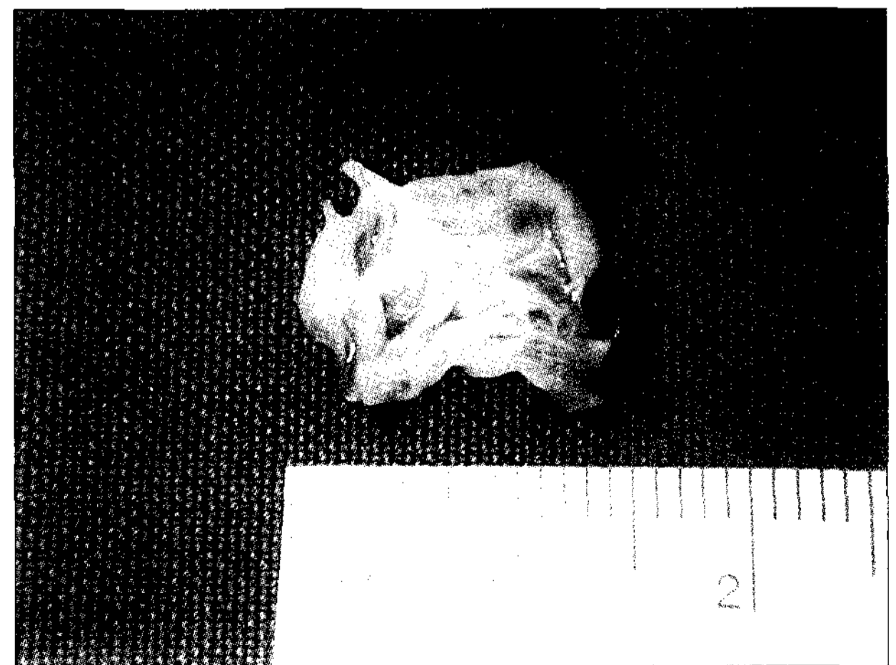
Fig. 3. Macroscopic findings of accessory valve leaflet.