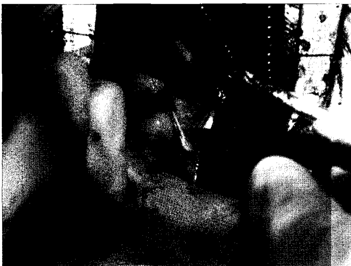
Fig. 2. Operative findings shows accessory mitral valve leaflet tissue.