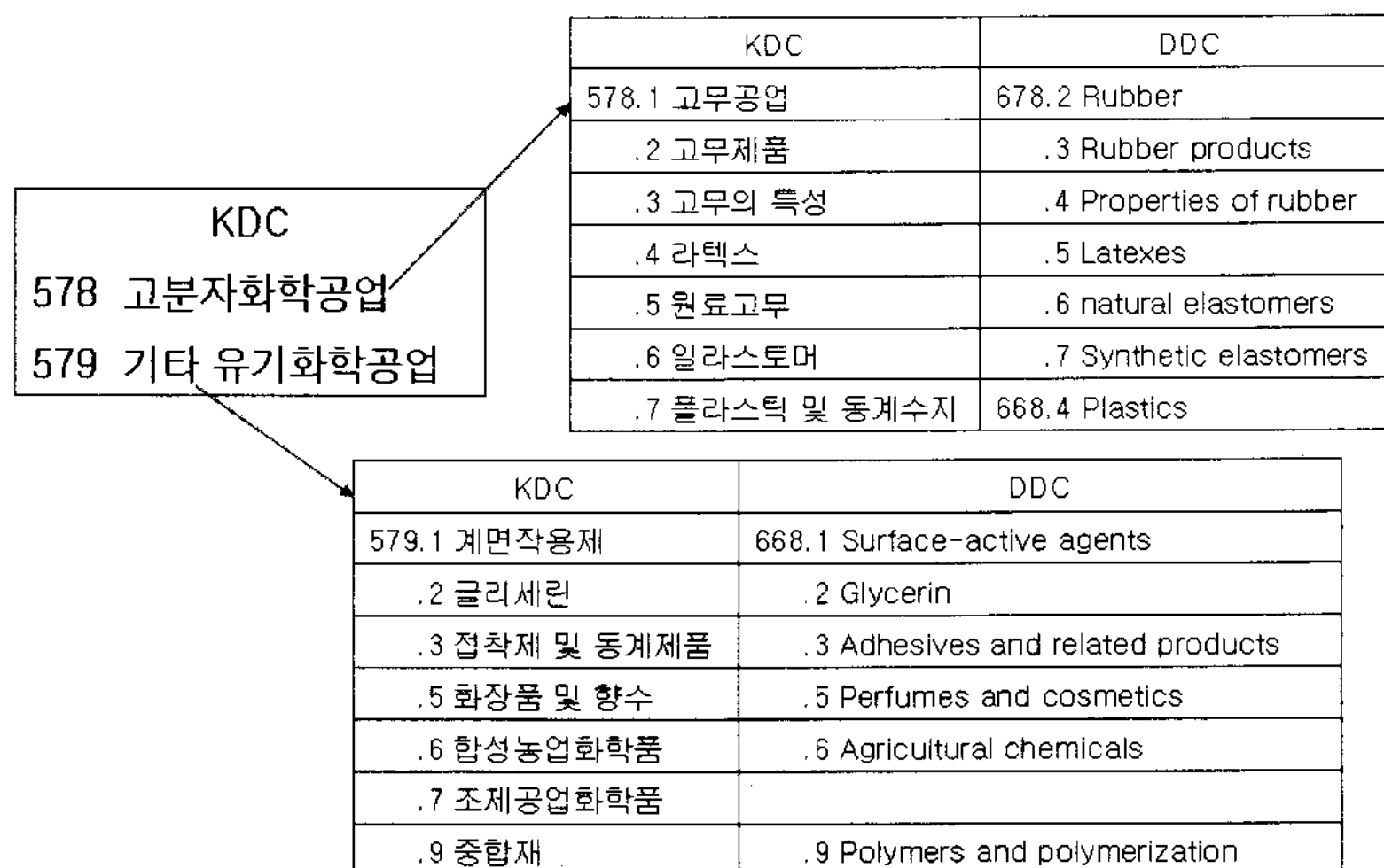
〈그림 2〉 KDC 578/579의 DDC 참조내역