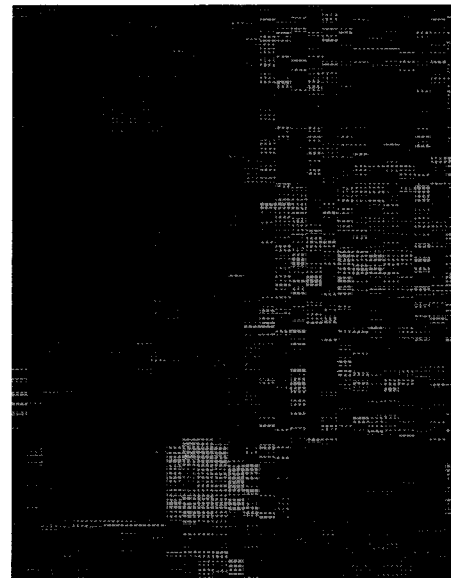
그림 3. 마이크로어레이 데이터의 군집분석 예

그림 3은 주어진 원래 데이터를 전처리한 후에 군집분석할 결과의 일부를 보인 것이다. 군집분석된 결과를 보고 관심있는 부분을 분석자가 시각적 확인하고 해당되는 추출할 수 있다. 그렇지만 수만 또는 수천개의 유전자가 시각적으로 표현되는 상황에서 유의한 유전자를 시각적으로 확인하여 추출하는 것은 노력이 많이 필요하다.