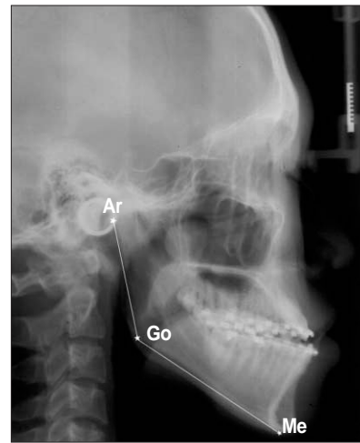
Fig. 4. Ar: articulare Go: gonion Me: menton Ramus height: Ar~Go Gonial angle: Ar~Go~Me.