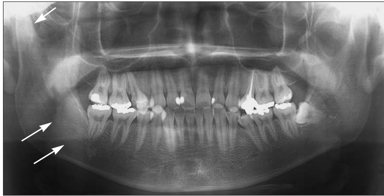
Fig. 1. Pre-operative X-P findings (case No.5). There is osteosclerosis in the circumference of the mandibular right third molar area.