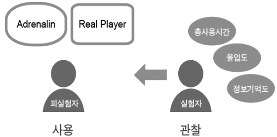
그림 3. 실험 2의 상황 설계

또한 몰입도 평가에서 예상사용시간을 묻는 질문은 사전에 미리 공지하지 않았으며 정보기억도 평가 역시 피실험자가 미리 예상하지 못한 상황에서 미디어플레이어사용을 마친