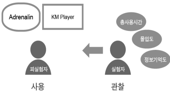
그림 4. 실험 3의 상황 설계

실험을 시작하기 전 피실험자들 에게 ‘미디어플레이어의 선호도 조사 연구’라는 임의의 연구 주제를 알려 주었다. 그리고 피실험자가 실험을 수행 하는 동안 실험자가 초시계를 가지고 각 미디어플레이어를 사용하는 시간을 측정하였다. 미디어플레이어 사용의 순서를 피실험자가 바뀔 때마다 바꾸어 사용하게 하였으며 이는 미디어플레이어의 사용 순서가 평가에 미칠 수 있는 영향을 통제한 것이다.