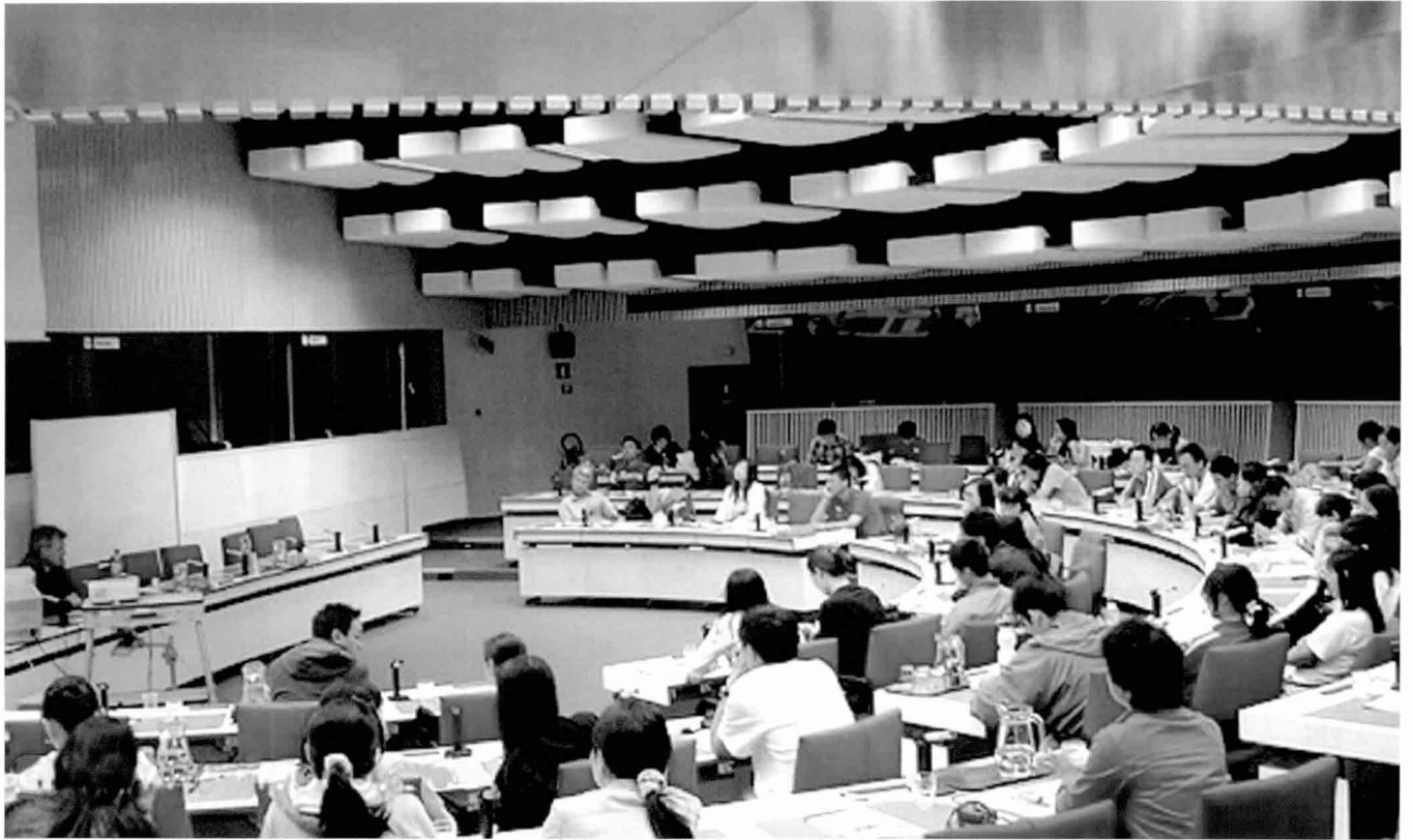
북경대학생들이 강의를 듣고 있는 모습