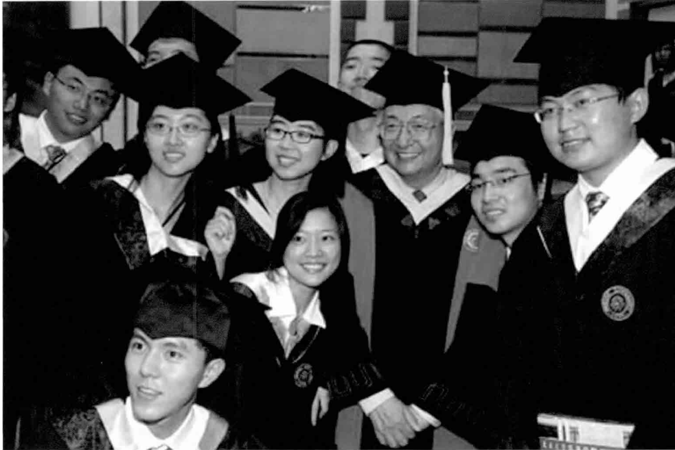
북경대학생들이 지난 7월 학위 수여식을 마치고 즐거워하고 있다.

200만 위안(약 3억 원)의 연구비를 지원하는 조건으로 매년 100여 명의 중국인 우수과학자를 유치' 등을 들 수 있다.