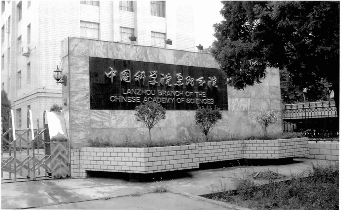
중국 서북 자원환경 연구의 중심으로, 향후 이 지역과의 교류 및 협력을 위한 주요 거점이 될 수 있을 것으로 기대되는 중국과학원 랴저우분원

과를 토대로 문제점을 개선하며 개혁정신을 가진 신세대 혁신자들을 양성한다는 지침을 세우고, 통일적인 계획과 단계별 시행, 중점 돌파의 원칙을 시종일관 고수하였다.