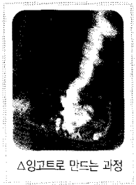
△잉고트로 만드는 과정