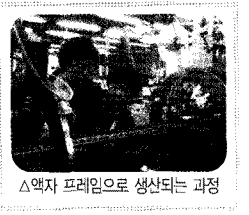
△액자 프레임으로 생산되는 과정