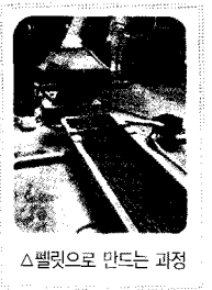
△펠릿으로 만드는 과정