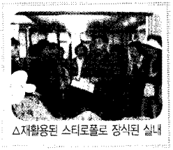
△재활용된 스티로폼로 장식된 실내