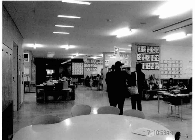
1. 고쿠라성 2. 알도르시의 알팔라포호텔 스케치 3. 아크로스 후쿠오카 내부전장 4. 하카타 소학교 교장선생님의 학교안내 5. 하카타 소학교 내부교실 및 홈베이스

원래는 한국건축문화대상 심사위원장이신 부산건축사회 정태복 회장께서 인솔자가 되셔야했는데, 사정상 못가시게 되어 차례를 따라 다른 위원에게 양보가 되었다. 그런데 공교롭게도 모든 심사위원들이 참여하시기 어려운 입장이 된지라 가장 막내격인 필자가 인솔자가 되어 학생들과 동행하게 된 것이다. 물론 필자도 업무상 여러 사정이 있었지만, 앞으로 우리의 후배가 될 예비건축사인 그 학생들과 함께 자리를 하고 싶은 맘이 들었기에 제안이 왔을 때 기꺼이 참여의사를 전했다.