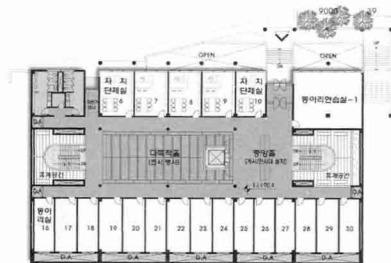
지하 4층 평면도