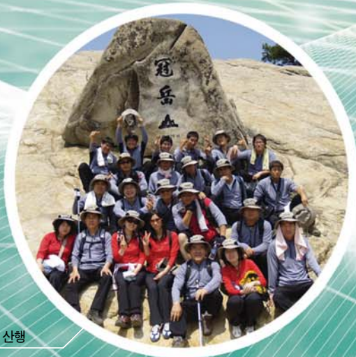
지난 5월 20일 관악산 산행