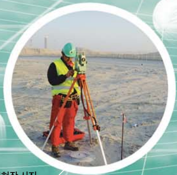
카타르 시공측량 업무현장 사진