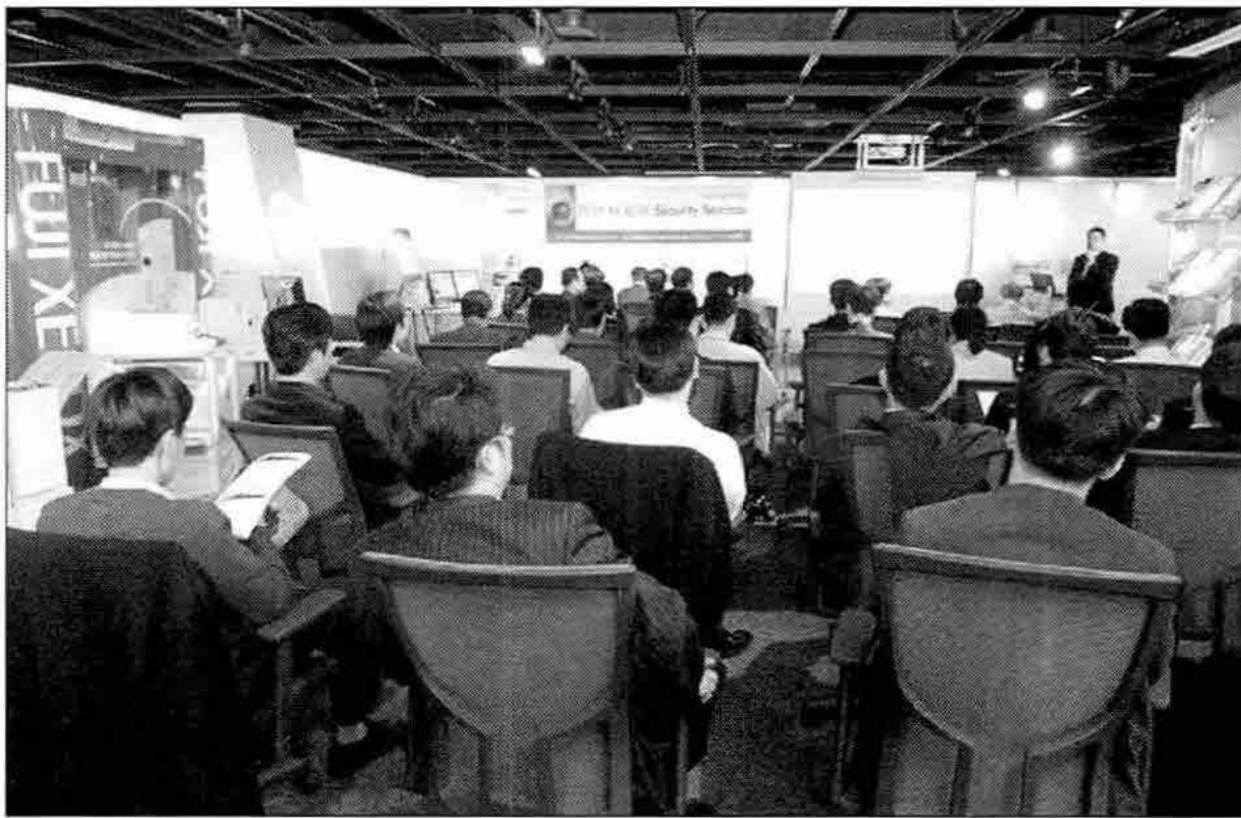
▶ 한국후지제록스는 3월 18일 서울 정동 본사에서 보안솔루션 업체 더존ISS, 소프트캠프와 함께 문서보안 세미나를 개최했다.