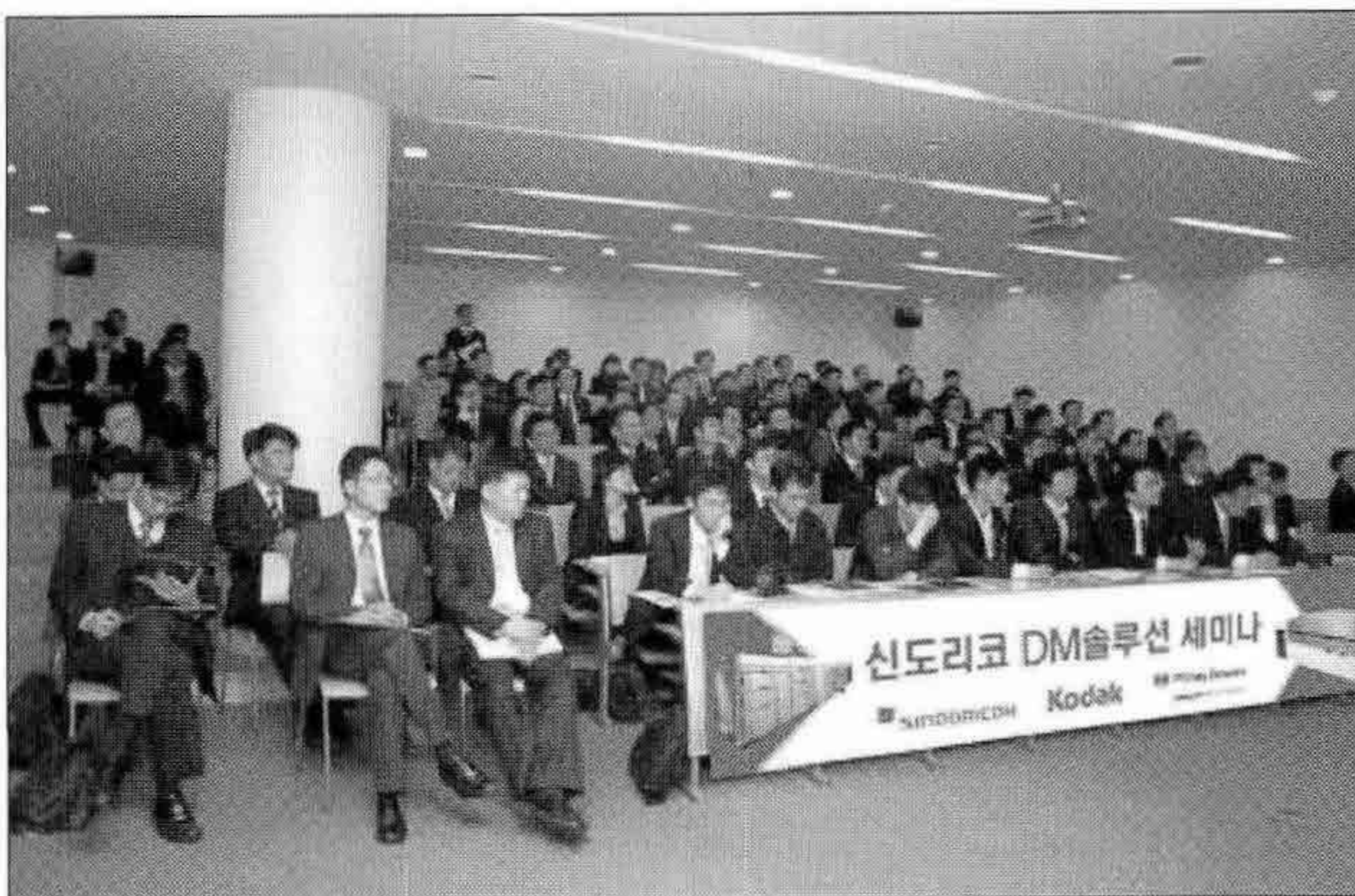
▶ 신도리코는 3월 18일 은행·보험·증권·카드·통신업계 고객관리부문 실무자와 DM업계 관계자 100여 명을 초청한 가운데 'DM 솔루션 세미나'를 개최했다.

신도리코(대표·우석형)는 지난 3월 18일 서울 성수동 본사에서 'DM(Direct Mail) 솔루션 세미나'를 열고 청구서를 고객 연령·성별·기호에 따라 맞춤 출력하는 DM솔루션을 선보였다.