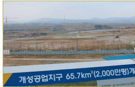
개성공단의 제화공장 내부모습