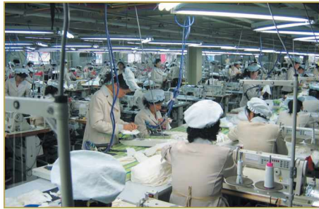
의류공장 내부 전경

눈으로 보이는 북한의 모든 산은 들은 바 대로 나무 한 그루 없는 벌거숭이 산이었다. 큰 비가 올 때마다 산사태가 나고 있고, 이로 인해 산은 척박한 토양만 남게 되어 식목을 하여도 나무가 뿌리내리기가 쉽지 않게 되었다. 남한에서는 북한의 산림사업을 지원하고 있다. 북한 주민의 어린 묘목을 땀감으로 사용하는 것도 문제이지만 묘목 뿌리가 착근할 수 있도록 관리하는 문제가 더욱 어려운 문제였다. 현지 관계자의 말로는, 공단 토지만 빼고는 모두 남한에서 가져