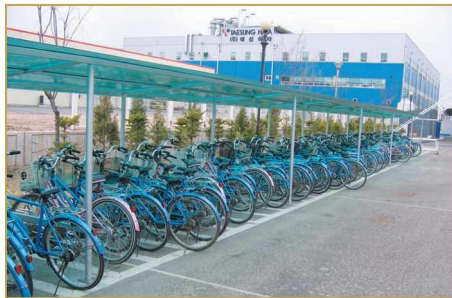
공장내 주차된 자전거