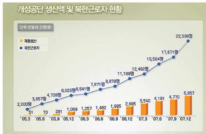
〈표2〉 개성공단 생산액 및 북한근로자 현황

자료 : 통일부( http://www.unikorea.go.kr/ ), 검색일 2008. 3. 20