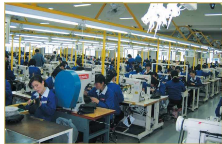
제화공장 내부 전경