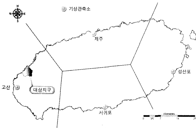
Fig. 2 Meteorological stations and Thiessen network of the study region

과우일수는 기준일을 설정하여 무강수일 혹은 일정량 이하의 강수량을 갖는 일수를 포함하여 기상학적 가뭄을 나타내는 방법이다. 일반적으로 5 mm 이하의 일강수량 (미국에서는 6.4 mm 이하)은 수문 및 농업에는 아무런 영향을 미치지 않는 강수로 구분하고 있다. 즉, 과우일수는 5 mm 이하의 일강수량과 무강수일에 대하여 정의하는 것이 일반적인 방법이다 (Kim et al., 1996). 본 연구에서는 5 mm 이하의 일강수량을 포함한 무강수일을 순별로 계산하여 과우일수를 산정하였다.