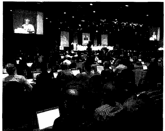
〈그림 1〉 WTSA-08 회의장면

1865년 5월, UN 산하 조직으로 신설된 국제전기통신연합(ITU, International Telecommunication Union)은 전파규칙, 주파수 할당 등의 이슈를 다루는 전파통신 부문(ITU-R, Radiocommunication Sector), 전기통신기술, 운용 및 요금 등의 이슈를 다루는 전기통신표준화 부문(ITU-T, Telecommunication Standardization Sector), 그리고 개발도상국의 통신망 현대화를 위한 정책, 기술적 지원 등을 다루는 전기통신개발 부문