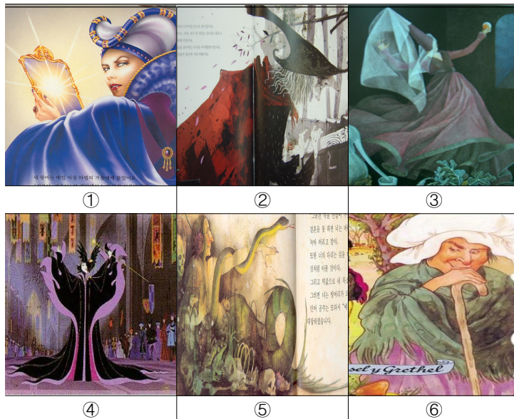
① <백설공주> 속 왕비 의상에 사용된 남색과 보라색, ② <헨젤과 그레텔> 속 마녀 의상에 사용된 검은색과 빨간색, ③ <백설공주> 속 왕비 의상에 사용된 보라색, ④ <잠자는 숲 속의 공주> 속 마녀 의상에 사용된 검은색과 보라색, ⑤ <인어공주> 속 마녀 몸체에 사용된 녹색, ⑥ <헨젤과 그레텔> 속 노파로 분장한 마녀 의상에 사용된 녹색,