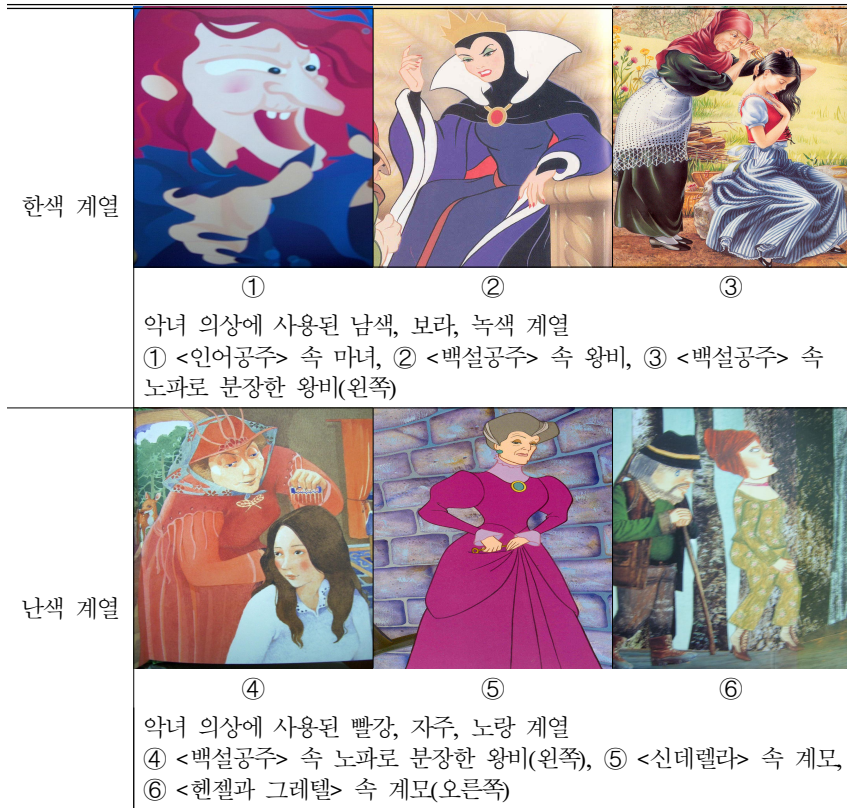
<표 4> 의상에 표현된 한색과 난색