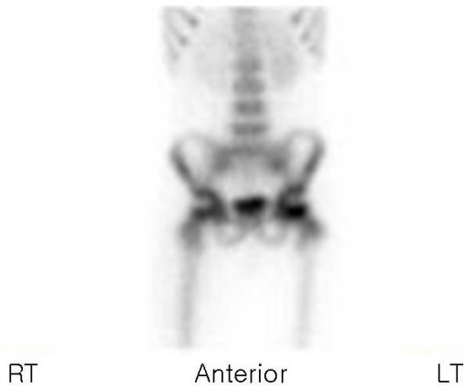
Fig. 1. Tc-99m MDP bone scan shows decreased uptake in the right femoral head due to soft tissue swelling.

이 9.84 mg/dL로 감소하였으며, 항생제에 대한 감수성 결과를 확인하였다(Table 1). 같은 날에 서혜부에 통증을 동반한 결절성 종괴가 촉진되어 초음파를 시행하였다. 우측 대퇴정맥에 심부정맥 혈전증이 보여(Fig. 3) 혈액 응고에 관여하는 인자들을 측정하였으나 모두 정상 범위에 있었다. 기존의 항생제 정맥 투여를 유지하였고, 입원 6일째부터 헤파린(75 IU/kg 부하 후 20 IU/kg/hour) 점적 주사를 시작하였으며, aPTT는 60-85초로 유지하였다. 증상 호전을 보이던 중 입원 12일째에 다시 체온이 39°C로 측정되었고, 두통을 호소하였으나, 백혈구 4,100/mm 3 (중성구 65%, 림프구 31.2%), 혈청 침강 속도 81 mm/hr, C-반응성 단백질은 1.7 mg/dL로 이전보다 감소하여 추가적인 세균 감염의 증거는 없었다. ASO는 2,031.8 IU/mL로 증가하였다. 입원 13일째부터 기존에 투여하던 clindamycin만 정맥 투여하고 warfarin을 경구복용하며 International Normalized Ratio (INR)를 2-3으로 유지하였다. 입원 14일째에 발열은 소실되었고 증상도 호전되었으며 초음파 추적 검사에서 우측 대퇴 정맥에 보이던 혈전의 범위가 감소하였다. 입원 22일째에 추적 관찰한 자기공명영상에서