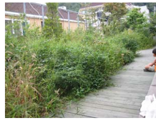
그림 13. 야외정원

조경치료에선 경관치료와 원예치료가 동시에 이루어져야 효과적이다. 경관치료에선 허공으로의 조망을 통해 자연, 공기, 물, 햇빛을 마주하며 생명력을 불러일으킴으로써 내면적 자유감과 자존감이 충족된다. 반면 원예치료 측면에선 흙과의 촉감을 통해 자연과 합일된 감각의 체험을 가능케 하여 피난처적 만족감이 충족된다.