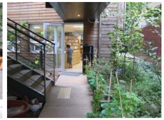
그림 14. 입구에 조성된 화단

성미산 학교는 최상층에 음악, 율동프로그램을 동시에 진행할 수 있는 음악실과 지하층 다목적실을 운영하고 있다. 평면도를 살펴보면 음악실과 미술실이 중정을 사이에 두고 마주하고 있는 것을 볼 수 있다. 그러나 서로의 독립된 시야를 확보하기 위해 음악실의 경우 다른 층의 교실과는 다르게 중정을 향하지 않고 반대쪽 벽에서 창이 내어져있다. 이 창을 통해 미술실과 유사하게 허공으로의 조망 확장을 이룰 수 있다. 음악실은 중정을 향한 벽면에 악기들을 정리해둘 수 있는 악기장을 제외하고는 다른 어떠한 율동을 제약하는 공간적 요소는 두고 있지 않다. 다른 교실보다 입구를 작게 두어 아이들의 노랫소리 확산범위를 음악실 공간에 한정시킬 수 있게끔 하였다. 한쪽 벽면은 전면 거울을 두어 아이들은 자신의 움직임을 세부적으로 관찰할 수 있게 된다. 이는 내면세계 생명감각을 통해 자존감을 향상시켜주고 있고 자신뿐 만이 아닌 주변의 움직임을 관찰 할 수 있는 시각적 흐름을 제공하여 사회적 조망을 만들어내고 이를 통한 정서 교류 증대를 통해 공동체적 자존감을 지원하고 있다.