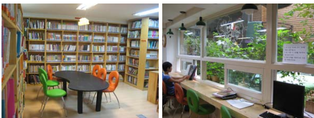
그림 5. 상대적인 허공적 요소 그림 6. 빛의 유입 통로(전창)

사례학교의 도서관은 학교의 입구로 들어섰을 때 가장 먼저 마주치게 되는 공간이다. 교실 2개를 합친 약 25평형의 넓은 공간으로 별도의 구획 없이 높낮이가 다른 책장을 이용하여 공간을 구획하고 있다. 입구에서 가장 멀리 떨어진 벽측 공간은 높은 책장을 양쪽으로 배열하여 외부의 시선을 차단함으로써 공간에 들어섰을 때 피난처성을 띤 독립된 공간을 제공해 만족의 감정에의 집중에 도움을 준다. 주변시야범위의 확보는 이루어지지 않지만 선형(linear)의 배치는 타인과의 분리를 이루게 한다. 외부 교류와는 분리된 치유 프로그램 특성으로 인해 이 선형공간을 별도로 벽체를 통해 각자에게 분배하지 않더라도 다수의 피난처성을 띤 심리적으로 독립된 공간을 만들 수 있다. 뿐만 아니라 실 가운데는 낮은 책장의 배치를 통하여 상대적으로 개방된 공간을 형성 하였고 안마당으로의 시선을 열어줌으로써 사색(meditation)을 통한 안정감을 얻게 하고 있다. 부드러운 빛이 유입되는 안마당은 허공으로써 내면적 자유의 감정을 지원하고 있는 것이다.