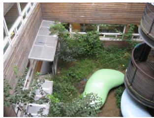
그림 12. 안마당

아이들의 놀이 공간으로 안마당에서 아이들은 자연 및 서로간의 교감을 통해 사회의 일원으로서의 안정된 보호감각을 형성해 피난처적 만족감을 충족하고 있다.