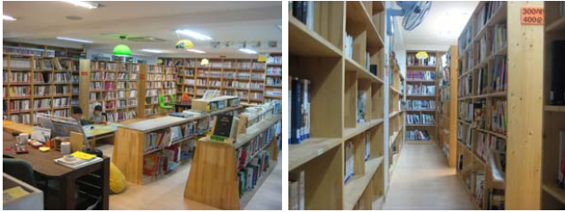
그림 3. 도서관의 내부 그림 4. 도서관의 선형적 공간

는 치료매개체인 책을 통해 지식교류를 하며 이와 함께 자신의 내면과의 정서적 교류를 이룬다. 이처럼 독립적인 치유방법 중 하나로써 개인이 외부에서 자유로워져 사고의 교환과 정신적 교환이 동시에 원활히 이루어 질 수 있는 공간을 요구한다.