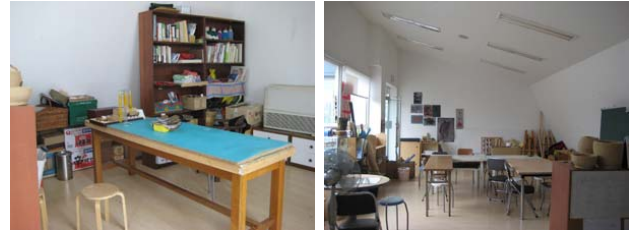
그림 7. 목공예실 그림 8. 미술실

술은 자신과의 대화를 통해 내면의 세계로의 집중이 이루어지고 이를 눈과 손을 통해 무의식적인 행동으로 표현한다. 일정한 호흡 리듬 반복을 통하여 부정적인 감정을 억누르는데 도움을 준다. 이로써 자아존중감과 성취감 그리고 내면적자유감을 불러일으킬 수 있다.