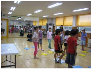
그림 11. 음악실

음악치료와 율동치료 모두는 외부로 자신의 가장 순수한 모습을 표출시킴으로써 자존감을 높이고 자신의 표정 및 외양과 움직임의 재확인할 수 있는 공간요소를 필요로 한다.