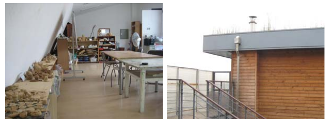
그림 9. 벽면에 전시된 작품 그림 10. 창으로 보이는 경관

성미산 학교는 미술치료를 위해 최상층(4층)에 미술실과 목공예실을 운영하고 있다. 미술실과 목공예실 역시 교실 2개를 합친 정도의 공간으로 두 실이 한 공간에 있지만 가구를 이용한 구획을 통해 독립된 두 공간처럼 사용하고 있으며 층고가 높은 공간 내에 공존하여 두 공간 모두에 여유감과 해방감이 제공되고 있다. 이는 미술이라는 정적인 행위 특성으로 인해 동적 행위가 이루어지는 공간과 달리 가구만으로도 공간구획이 가능했던 것이다. 루돌프 슈타이너는 색채는 현실적인 영상이 아니며 생명, 영적인 영상이라고 하였고 녹색, 살구색, 흰색으로 상승해 가면서 생에서 혼으로 가까워진다고 하였다. 흰색벽면의 노출을 최대화하고 내부로의 빛의 유입을 최대화하여 흰 공간을 극대화시킴으로써 자아, 영혼과의 교류를 불러일으킨다. 동시에 피난처성의 목표인 평온의 상태 또한 충족시킨다. 작업대와 전시대 이외의 불필요한 solid는 제거함으로써 내면적 자유의 확장을 돕고 상시 전시되어있는 자신의 결과물을 통해 자아와의 교감 또한 이루어지게 된다. 미술실의 전창은 도서관의 그것과는 다르게 하늘을 향한 시야의 확보를 이루고 자연 속에서 자신이 하나의 존재임을 인식하여 자존의 확립을 이루게끔 한다. 실을 최상층에 위치시킴으로써 외부 시선의 내부로의 유입을 차단하여 피난처성과 조망성이 공존하는 공간, 즉 만족감과 자존감을 모두 충족하게 하고 있다.