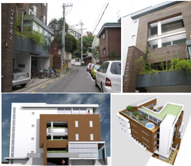
그림 2. 성미산 학교의 외관

성미산 학교는 서울시 마포구 성산동 주택가에 위치하고 있으며 2004년에 개교한 비인가형 대안학교로 단독시설로 운영되어지고 있다. 1994년 서울 마포에 세워진 공동육아 어린이집을 모태로, ‘성미산 지키기 운동’을 벌였던 마포구 일대 주민들의 마을지킴이의 일환으로 ‘마을학교’를 목표로 설립되었다. 지역주민인 학부모와 교사가 중심이 되어 운영하고 있으며 이 때문에 학교와 마을주민과의 원활한 커뮤니케이션이 이루어지고 있다. ‘스스로 서서 서로를 살리는 사람’ 즉, 올바른 관계 속에서 스스로 선 사람은 자연과 사회 나아가 우주 만물의 흐름을 바르게 알고 모두를 살리게 한다라는 교육 이념으로 아이들을 교육하고 있다. 교육대상은 탈학교학생뿐만 아니라 자발적 선택을 통한 아이들로 이루어져있고 장애학생을 위한 특별교사 2명이 배치되어 있다.