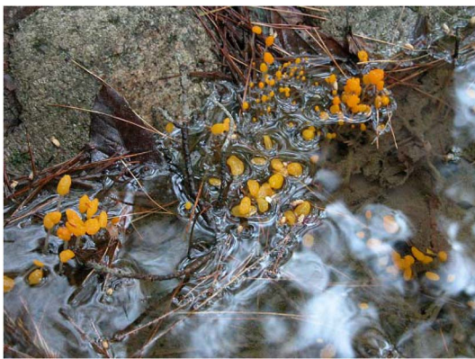
Fig. 1. Mitrula paludosa Fr. ascocarps on pine needles soaked in clean and cool creek water in Sogri Mt. National Park.

록된 M. paludosa 는 자실체의 모양과 색깔, 크기에서는 본 속리산에서 채집된 M. paludosa 와 차이가 거의 없지만,