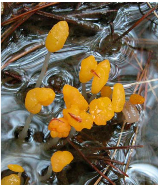
Fig. 2. Wrinkled oval ascocarp of M. paludosa .