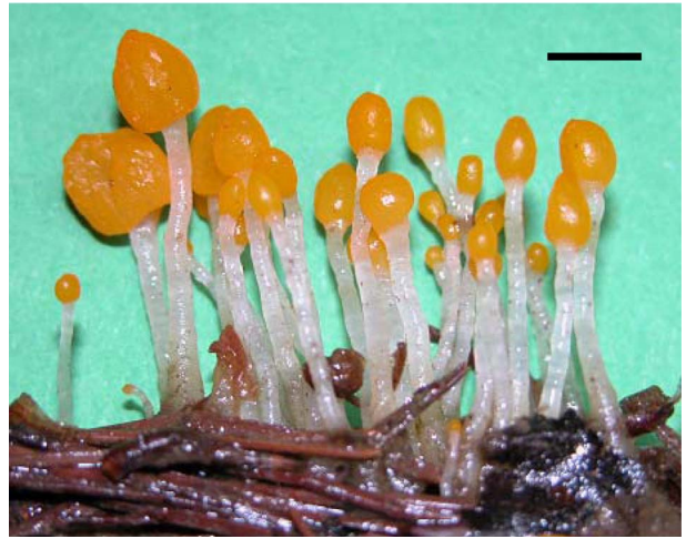
Fig. 3. Young M. paludosa on fallen needles. bar = 1 cm.