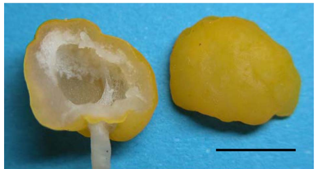
Fig. 4. Section of of M. paludosa cap. Outmost yellow thin hymenium and inside cavity. bar = 2 cm.