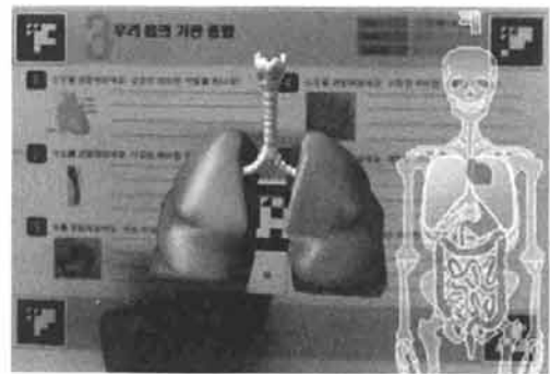
<그림 2> 우리 몸의 생김새 AR 콘텐츠 예시 화면

AR 콘텐츠는 2008년 KERIS와 전자통신연구원(ETRI)이合作하여 개발한 6-1학기 '우리 몸의 생김새'를 사용하였으며 2008년 7월에 수업을 실시하였다.