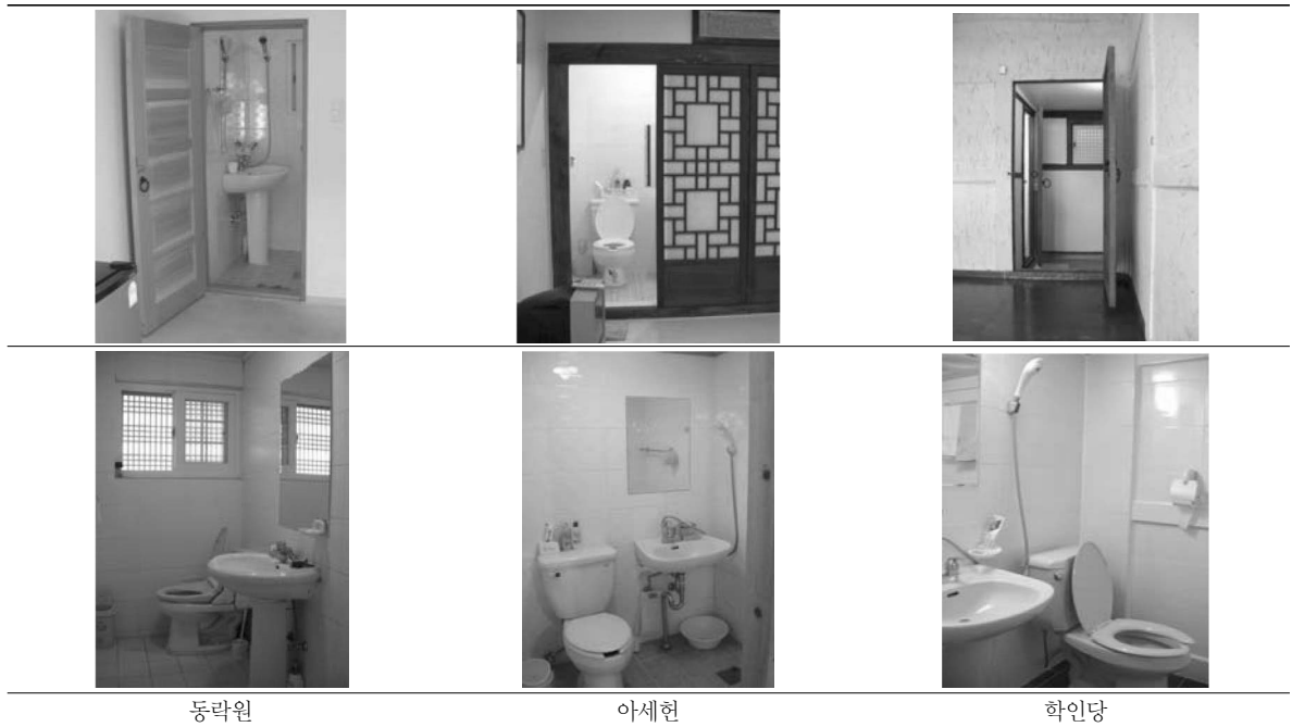
〈표 8〉 조사대상 전통 한옥 숙박시설의 내부 욕실 및 화장실 사진

전통 한옥의 창살문과 오늘날의 주택에서 볼 수 있는 현대적인 문의 형태가 혼용되어 나타나고 있었다. 또한 외부와 면한 창은 전통 창살 형태로 되어 있었으나 내부의 창은 일반적인 미닫이 창으로 되어 있기도 함으로써 형태의 통일성을 찾아볼 수 없었다. 이에 따라 앞으로는 한국의 전통성이 각 공간별 계획 요소에 좀 더 신중하게 반영될 필요가 있는 것으로 나타났다.