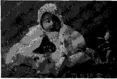
〈그림 4〉 백일 사진 1933년

승상하여 흰색의 옷을 즐겨 입었다 30) 는 설 이외에도 흰색 의복은 깨끗해 보일 뿐 아니라, 아기의 의복은 자주 세탁해야 하기 때문에 위생이나 실용적인 면에 적합했을 것이다.