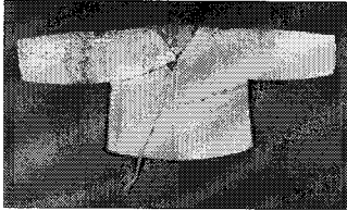
<그림 1> 배넛저고리 박체× 소장, 1933년

<그림 1>은 박체× 소장의 배넛저고리로 소장으로 만들어져 있으며 실로 고름을 단 것으로 기본적인 배넛저고리의 형태를 볼 수 있다. <표 2>는 개별면접자가 사용한 배넛저고리의 특성을 정리한 것이다.