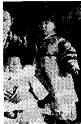
<그림 5> 남아 돌 사진 조라× 소장, 1926년경

여러가지 색상을 사용해서 아동의 복식을 만들어 입혔던 경우에는 오행의 의미보다는 색상의 화려한 배열에서 오는 미적인 면을 중요하게 생각했다.