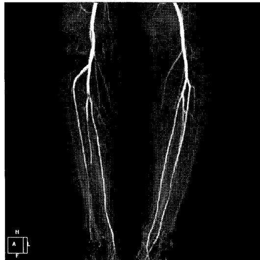
Fig. 4. Postoperative CT angiography shows well enhanced right popliteal artery with slight filling defect on tibioperoneal trunk artery.

정맥의 내측 및 심부 방향으로 주행하였고 비복근 내측두의 일부 근육이 슬와동맥과 슬와정맥 사이에 위치하며 근육 밴드를 형성하여 슬와동맥을 누르는 소견을 보였다 (Fig. 2). 이 근육 밴드를 절개하고 슬와동맥 전장을 노출시켰으며 종으로 약 6 cm 정도 길이의 동맥 절개를 가하였다. 동맥 내부는 오래된 혈전이 있었고 내막이 조금 두꺼워진 소견을 보였다. 3 프렌치 및 4 프렌치 풍선 카테타를 이용하여 슬와동맥, 전경골동맥, 그리고 경골-비골 간부 동맥(tibioperoneal trunk)에 있었던 혈전을 제거하였으며 내막 절제도 비교적 쉽게 할 수 있었다. 내막 절제 후