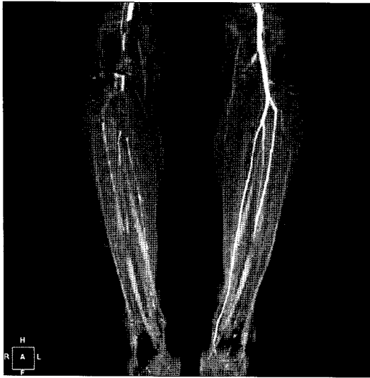
Fig. 1. Preoperative CT angiography shows filling defect with medial deviation of right popliteal artery.