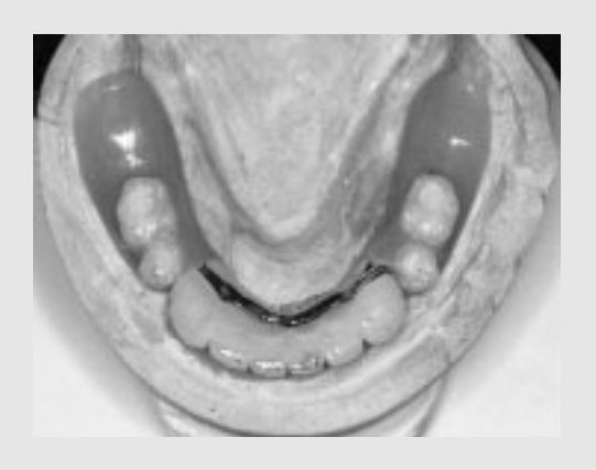
Fig. 2. The minimized cantilever

완전무치악에서 상악은 총의치로 수복하고 하악을 4개 임프란트를 이용 전방부 지대치를 수복해 주고 구 치부를 국소의치로 제작하는 것이다. 이 때 임프란트 식립부위는 양쪽 견치부와 소구치부위에 4개를 식립 하는데 소구치부는 최대한 구치부로 심어주어 악궁에 서 지대치부위의 전후방 길이를 최대로 하여 국소의치 로 인한 캔틸레버 작용, 즉 측방력을 최대로 줄여주는 것이 역학적으로 유리하다고 하겠다. 또한 국소의치 에도 의치를 적게 심어서 A-P거리보다 캔틸레버길이 가 적을수록 역학적으로 유리하다(Fig.1, Fig.2). 임 프란트의 직경이나 길이, 하악골의 양과 질, 환자의 저작력을 고려하여 캔틸레버길이를 정한다. 이 술식 에서 가장 큰 장점은 최소의 경비로 최대의 효과를 얻 을 수 있다는 점이다. 상악 총의치는 하악에 비해 유지