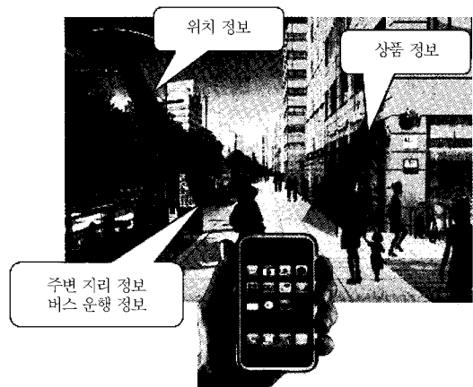
(그림 3) 각종 정보 응용 서비스

(그림 3)은 사용자의 휴대 단말기에 가시광 무선통신장치를 장착한 경우, 제공 가능한 응용서비스들에 대해 나타내었다. 사용자의 현재 위치 정보를 조명등으로부터, 인근 상점으로부터 상품정보를, 버스정류장으로부터 버스 운행 정보를 전달 받는 응용 서비스를 나타내었다. (그림 3)과 같이 가시광 무선통신을 이용하여 다양한 응용 서비스를 제공할 수 있으며, 특히 조명으로 활용하던 기존의 인프라를 사용함으로써 저탄소 녹색성장을 이루어 낼 수 있는 장점이 있다.