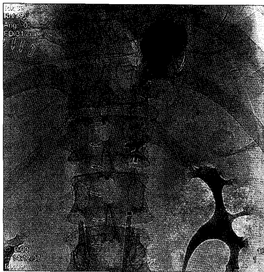
Fig. 3. The 22 mm amplatzer ® vascular plug (AVP; AGA medical, Golden Valley, MN, USA) was inserted at distal ligation site of aorta. After insertion, the leakage was decreased.

맥 파열, 그리고 수차례의 반복적인 수술 등을 고려하여 후 종격동 경로를 포기하고, 흉골 하 경로를 사용하였다. 식도 우회술 시행시 위장관을 올리는 경로는 후 종격동 경로(posterior mediastinum route), 흉골하 경로(substernal route), 피하 경로(subcutaneous route), 흉강 내 경로(transpleural) 등이 있으며, 이중 가장 길이가 짧은 후 종격동 경로가 흔히 사용되는 경로이지만, 감염, 유착 등의 이유로 사용하지 못할 경우에는 흉골하 경로가 대용 경로로 주로 사용되고 있으며, 나머지 피하 경로 또는 흉강 내 경로의 경우는 드물게 사용되고 있다[2]. 식도 우회술을 시행 후 기능을 못하는 식도를 남겨 두었을 때, 식도의 염증, 감염, 점액 분비 등으로 인해 식도암 발생 빈도가 높아진다는 것이 알려져 있으며, 역류성 식도염에 의한 출혈, 식도 낭종, 농흉의 빈도도 높아지는 것으로 알려져 있지만[3], 본 환자에서는 절제시 생길 수 있는 합병증을 고려하여 시행하지 않았다. 이에 대해서는 장기 추적 관찰이 필요할 것으로 생각된다.