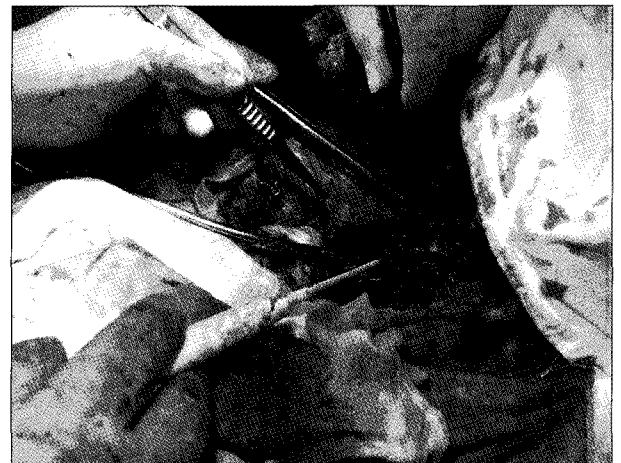
Fig. 3. The fistular opening to the esophagus is observed after removing the aneurysm.

으로 간주하여 경과 관찰하였고 시술 7일째 C 반응성 단백은 13 mg/dL로 증가되어 있었으나 백혈구 수치가 8,300/mm 2 로 감소하고 발열이 없어 추가적인 영상 검사 및 항생제 처방 없이 퇴원하였다. 이후 별도의 추적 관찰 없이 지내던 중 내원 1일 전 400 cc 가량의 토혈을 주소로 다시 응급실로 내원하였다. 토혈 발생 후 시행한 식도내시경 검사에서 대동맥-식도루가 의심되는 소견으로 본원으로 전원 되었다. 내원 당시 혈압 185/72 mmHg, 맥박수 85회, 호흡수 20회, 체온 36.5°C의 활력 징후를 보였으며 신체 검진 상 호흡음은 정상적이었으며 심음은 규칙적이었고 심잡음은 청진되지 않았다. 혈액 검사에서 백혈구수