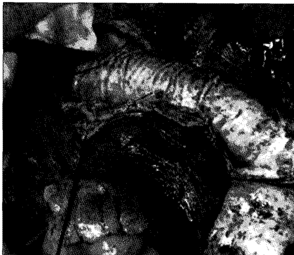
Fig. 2. A lot of purulent materials are shown on the surface of the stent-graft.

으로 간주하여 경과 관찰하였고 시술 7일째 C 반응성 단백은 13 mg/dL로 증가되어 있었으나 백혈구 수치가 8,300/mm 2 로 감소하고 발열이 없어 추가적인 영상 검사 및 항생제 처방 없이 퇴원하였다. 이후 별도의 추적 관찰 없이 지내던 중 내원 1일 전 400 cc 가량의 토혈을 주소로 다시 응급실로 내원하였다. 토혈 발생 후 시행한 식도내시경 검사에서 대동맥-식도루가 의심되는 소견으로 본원으로 전원 되었다. 내원 당시 혈압 185/72 mmHg, 맥박수 85회, 호흡수 20회, 체온 36.5°C의 활력 징후를 보였으며 신체 검진 상 호흡음은 정상적이었으며 심음은 규칙적이었고 심잡음은 청진되지 않았다. 혈액 검사에서 백혈구수