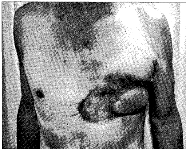
Fig. 2. Patient status 6 months after operation.