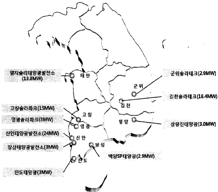
[그림 1] 국내 주요 태양광발전소 위치분포도 맵